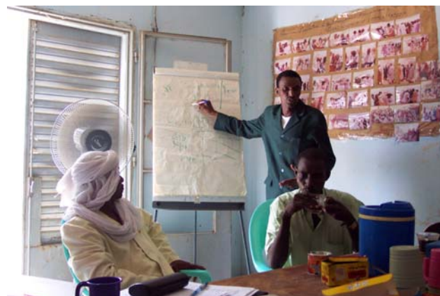
Maitouraré samler trådene

Men der er også mange, der udfører et betragteligt uegennyttigt stykke arbejde i et land som Niger! I forhold til vort fremtidige samarbejde med I&A var det vigtigt for GtU at præcisere, at GtU's medlemmer er ulønnede, og at det er motivationen ved at samarbejde og skabe udvikling, der er drivkraften.