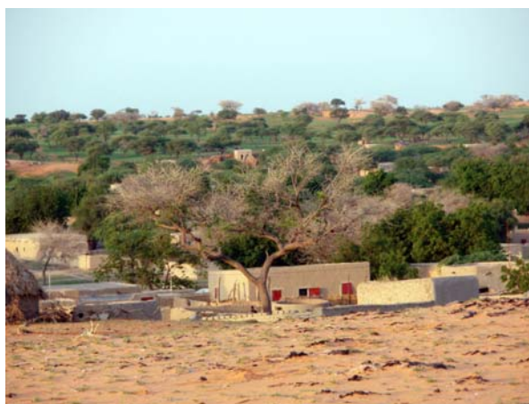
Udsigt over Maïné-Soroa

Og så forfægtede borgmesteren – helt på eget initiativ – sin opfattelse af Sameksistens i Kaoumaram! Og det vi hørte var sød musik i GtU-ører og fik os alle tre til næsten på kommando at trække vore skriveblokke frem!