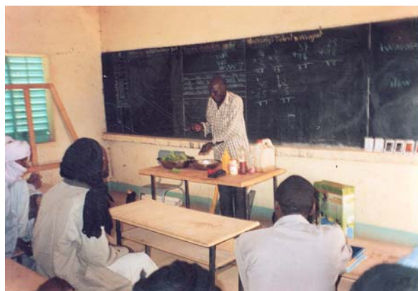
Demonstration af salattilberedning, foruden at læreren forklarer om fordelene ved grøntsagsdyrkning