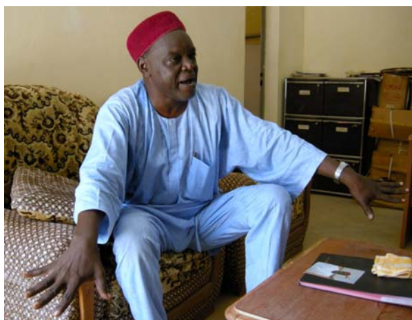
Begejstringen hos borgmesteren kunne fornemmes

Projektets historie er dokumenteret gennem talrige interviews, der også giver et enestående og nuanceret indblik i de synspunkter områdets beboere (herunder kvinder, børn og ældre) har fremført. Enkelte interviews har tidligere været bragt i Projekt & Kultur og flere vil følge.