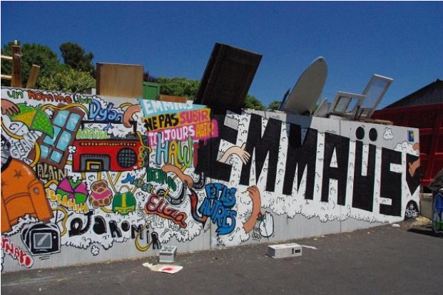
Fra Emmaus-Samfundet i Cabriès ved Marseilles i det sydlige Frankrig

Hver sommer arrangeres klunserlejlere med indsamling, sortering og salg rundt om i Europa.