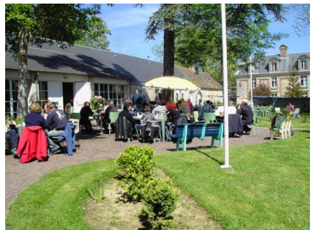
Fra Emmaus-Samfundet i Caen i Normandiet