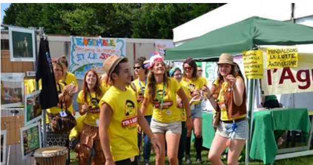
Fra Emmaus-Landsbyen i Lescar-Pau ved foden af Pyrenæerne i det sydlige Frankrig

For de fleste lejres vedkommende er det permanente Emmaus-samfund, der åbner dørene for unge mennesker i et antal uger, således at den frivillige betragtes som medlem af samfundet på lige fod med de fastboende, mens man er der, og til gengæld forventes det, at samfundets regler respekteres.