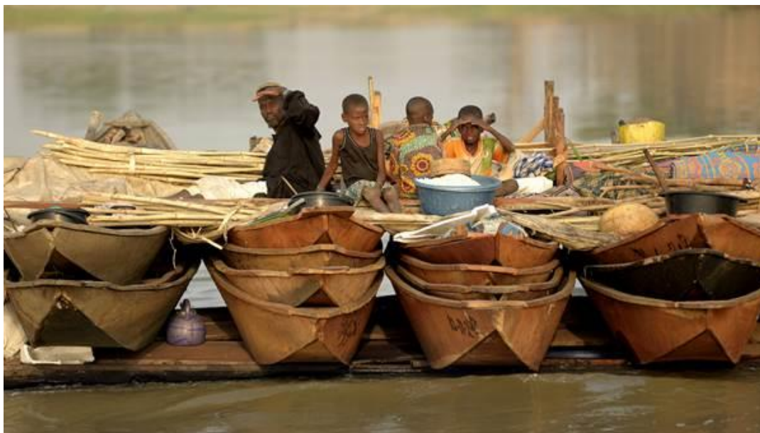
En flodnomadefamilie på vej til Mali – billedet er taget nær Gaya ved grænsen til Benin