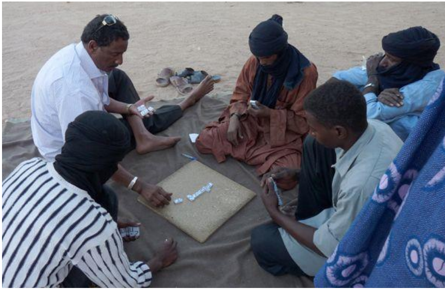
Der spilles dam i Tesselit