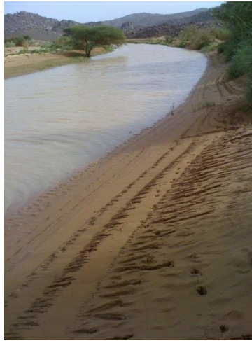
Floden, som løber gennem Tessalit