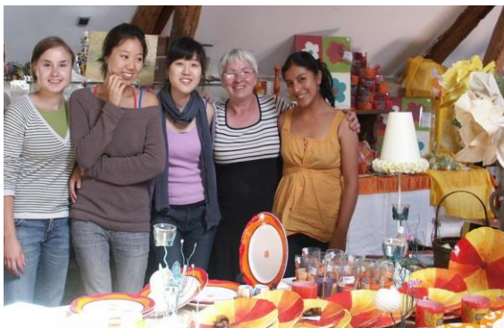
Fra Emmaus-samfundet i Brie-Montereau i det nordøstlige Frankrig

http://www.emmaus-europe.org/208-welcome-to-the-section-new-generations/175-the-summer-volunteer-programme-youth-camps-in-europe hvor man kan skifte mellem engelsk, fransk og spansk.