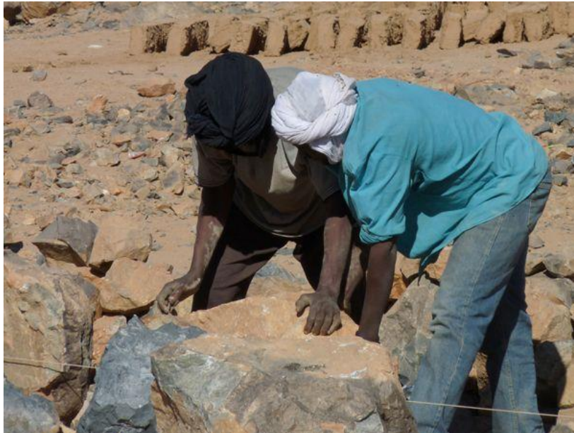
Nu skal Tessalit genopbygges

”Vi har fået nok af at være berøvet alting, intet drikkevand, 2 timers elektricitet om dagen, ingen telefoner, vi river akacietræerne op for at undgå miner, og på jorden ligger der oven i købet narkotiske stoffer, som børnene samler op, selvom Abrayabone fra Tinariwen 7 kom med en stok for at moralisere. Det er vores liv lige nu.