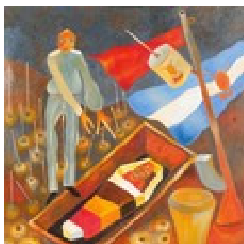
Han kæmpede for vort land – af Kizito Kasule Maria

Afro-art.dk har satset på kvalitetskunst. Nogle kunstnere er så dygtige, at de ikke er nødlidende – de har skabt sig en god tilværelse i kraft af deres evner og flid.