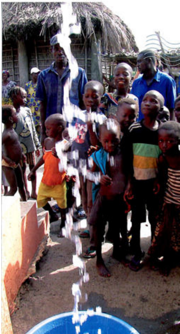
Da det rene vand kom til søen