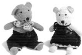
Scannet fra et katalog fra En Gry og Sif www.engryogsif.dk

Af nye ting har vi i Bazaren i år mange fine og hyggelige fildede varer fra En Gry og Sif, der siden 2009 har haft Fair Trade certifikat fra The World Fair Trade Organization, som også Bazaren er en del af. Foruden nisser og andre julerier har vi bl.a. nedenstående charmerende teddybjørne .