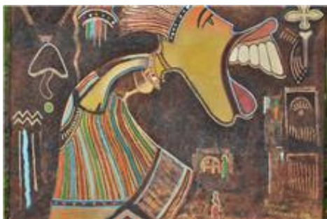
Kvindernes dag – af Robinson Kimanathi, Kenya.

Galleriet afro-art.dk, der hidtil har været drevet som privat firma, er pr. 1. november 2010 overgået til at være en forening. Det skyldes til dels, at jeg som kommende efterlønsmodtager har brug for at skulle modregne timer, men det sker også, fordi jeg gerne vil have andre inddraget i arbejdet. Og jeg er altså den, der for tre år siden startede afro-art.dk.