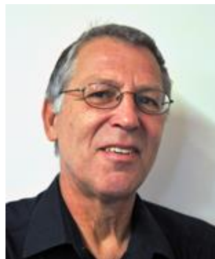
Willi Does Tyskland